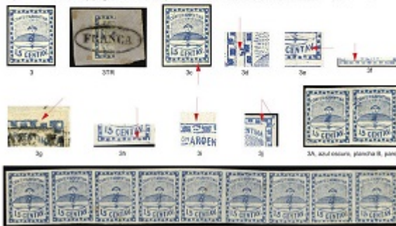
3a. Tira con los 9 Tipos

Jalil, Guillermo/Gottig José Luis Specialized Catalogue of Postage Stamps and Postal History of Argentina (2018/2019 edition), 2 volumes, hardbound, 728 pages.