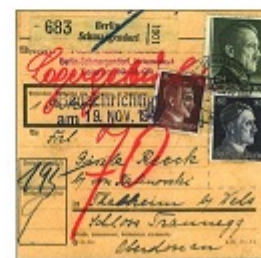
Gebührentabellen und Abbildungen von Paketkarten