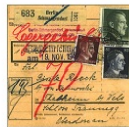
Gebührentabellen und Abbildungen von Paketkarten