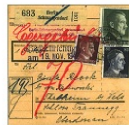
Gebührentabellen und Abbildungen von Paketkarten