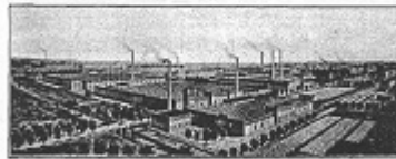
Die frühesten Fabrikanlagen.