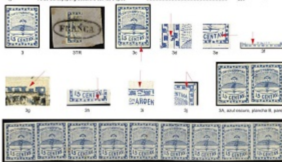
3a. Tre con los 9 Tipos

Jalil, Guillermo/Gottig José Luis Specialized Catalogue of Postage Stamps and Postal History of Argentina (2018/2019 edition), 2 volumes, hardbound, 728 pages.