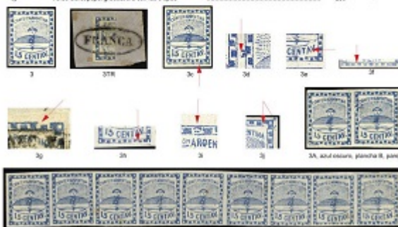
3a. Tira con los 9 Tipos

Jalil, Guillermo/Gottig JosÃ© Luis Specialized Catalogue of Postage Stamps and Postal History of Argentina (2018/2019 edition), 2 volumes, hardbound, 728 pages.