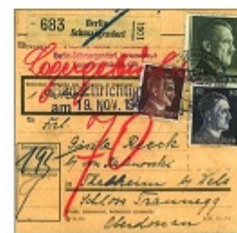
Gebührentabellen und Abbildungen von Paketkarten