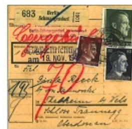
Gebührentabellen und Abbildungen von Paketkarten