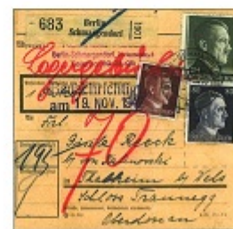
Gebührentabellen und Abbildungen von Paketkarten