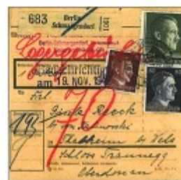
Gebührentabellen und Abbildungen von Paketkarten