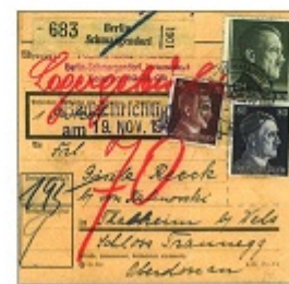
Gebührentabellen und Abbildungen von Paketkarten