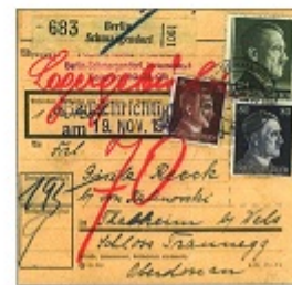
Gebührentabellen und Abbildungen von Paketkarten