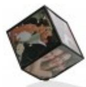
Foto-Würfel rotierend für 6 Fotos Nr. 73514